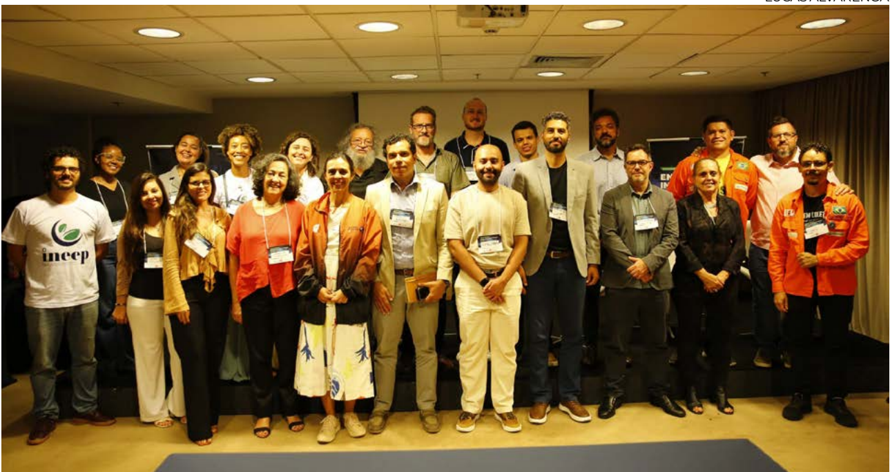
Seminário Internacional Energia, Integração e Soberania: uma plataforma para o Brasil, realizado nos dias 25 e 26 de março, no Rio de Janeiro