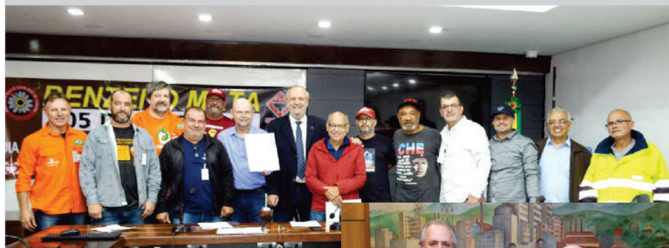
Coletivo de Sindicatos entregaram Carta pelo retorno da CNPBz e CEBz que os parlamentares levaram ao Ministro do Trabalho

Os Sindicatos alertaram para a gravidade que representa esta interrupção dos trabalhos sistemáticos desta Comissão no acompanhamento do cumprimento do Acordo Nacional do Benzeno (que é Lei) com suas orientações de boas práticas, principalmente nas reuniões e nas visitas às empresas, sempre com caráter orientativo que possibilitavam uma atuação em linha que iniciava com a Comissão Nacional (CNPBz), passava pelas Comissões Estaduais (CEBz), chegando aos Grupo de Trabalho do Benzeno (GTB) de cada CIPA nas empresas, implementando na prática as medidas de PREVENÇÃO à exposição a este produto cancerígeno.