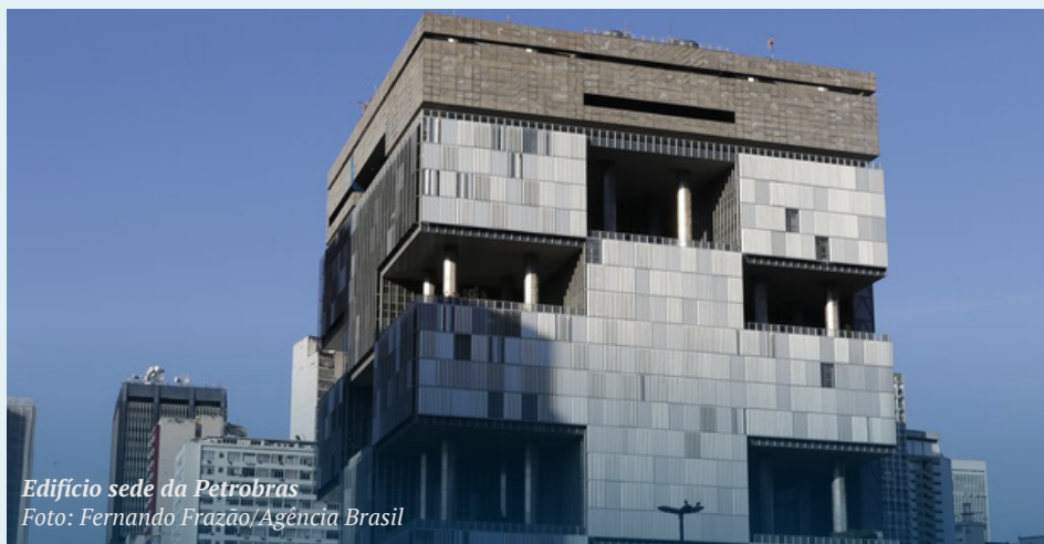
Edifício sede da Petrobras

Por isso, disputar os rumos da Petrobras é necessário para que o Brasil não perca a oportunidade de avançar nas transições em curso no segmento industrial energético e no sistema internacional. O Estado e a sociedade brasileira devem participar da construção dessa Petrobras do futuro. O diálogo social, e não apenas com atores de mercado, é condição para construção de uma transição justa, com equidade e inclusão social. O acesso a insumos energéticos com preços justos à população e valorização do trabalho também devem orientar as práticas da Petrobras nos próximos anos. Afinal, a magnitude industrial e o significado social alcançados por ela são fruto da permanente e histórica luta da sociedade brasileira e da categoria petroleira na defesa desse patrimônio nacional.