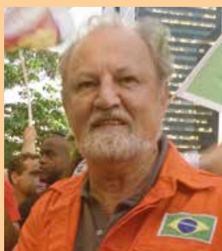
João Pedro Stedile Movimento dos Trabalhadores Sem Terra (MST)

"Os petroleiros estão fazendo uma greve patriótica para salvar a Petrobrás para o povo brasileiro. E o único patrimônio de riqueza natural que ainda podemos usar em benefício do povo é o petróleo".