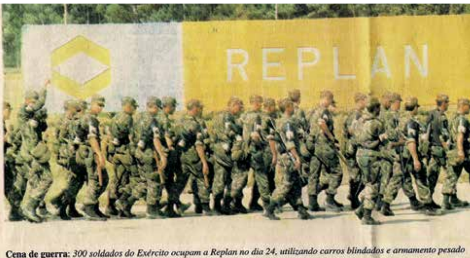
Cena de guerra: 300 soldados do Exército ocupam a Replan no dia 24, utilizando carros blindados e armamento pesado

A repressão do governo FHC estava apenas começando. Na madrugada de 24 de maio, o Exército invadiu a Refinaria de Araucária (REPAR), no Paraná, com cerca de 500 soldados. A mesma cena se repetiu nas refinarias de Paulínia (REPLAN), Mauá (RECAP) e São José dos Campos (REVAP), onde tanques do Exército intimidavam os trabalhadores. No dia 26 de maio, os petroleiros receberam seus contracheques zerados.