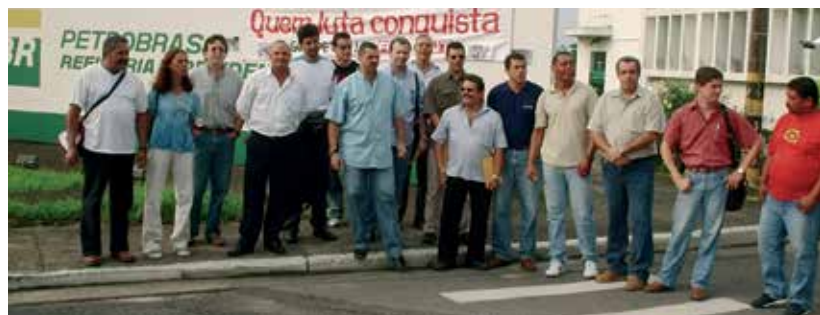
Ato político na RPBC marca retorno dos petroleiros demitidos que foram anistiados

Somente em 2003, após as mudanças políticas que aconteceram em função da eleição do presidente Luiz Inácio Lula da Silva, é que as demissões e punições começaram a ser revistas pela Petrobrás. A FUP, através de participação em comissões interministeriais e da postura firme nas campanhas reivindicatórias, garantiu a anistia de 88 demissões, 443 advertências, 269 suspensões e 750 punições de trabalhadores que participaram das greves de 94 e 95. Além disso, a luta pela anistia trouxe de volta aos quadros da Petrobrás mais de mil trabalhadores das extintas Interbrás, Petromisa e Petroflex. ■