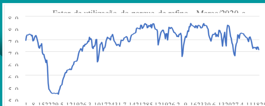
Fator de utilização global das refinarias do sistema Petrobras

Na última semana, no geral, a carga global de processamento de petróleo nas refinarias acompanhadas apresentou leve queda, fechando em 70,9% no dia de ontem. A tabela a seguir apresenta o fator de utilização por refinaria (FUT), no dia 17/01/2021, em relação à capacidade autorizada, em m 3 /dia.