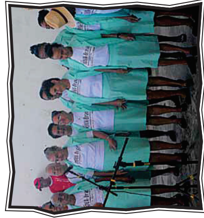
Ação pela Cidadania – Núcleo Paramoti

Pela primeira vez a cidade de Paramoti vivenciou uma ação de cidadania realizada na quadra da escola municipal Bela Vista, com apoio da prefeitura. A abertura foi marcada pelo coral formado por vinte educandos do Projeto, aplaudidos por todos da comunidade e também pelos parceiros que se fizeram presentes na ação. Na ocasião, vários atendimentos foram realizados: Conselho Municipal de Defesa dos Direitos da Criança e do Adolescente – 36 atendimentos; Conselho Tutelar – 36 atendimentos; corte de cabelo – 155 atendimentos; manicure – 68 atendimentos; palestra preventiva à saúde bucal – 48 atendimentos; teste de glicemia – 39 atendimentos; verificação de pressão arterial – 66 atendimentos; emissão de RG – 25 atendimentos; doação de sessenta pares de sapatos; distribuição de quatrocentos picolés; distribuição de 150 almoços. Mais informações em: http://www.paramoti.ce.gov.br/