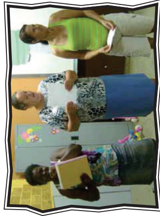
Educandas do Núcleo de Bom Jesus de Itabapoana