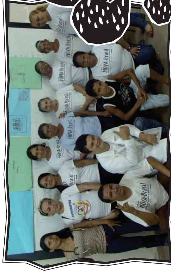
Turma da Comunidade Biribiri - Manacapuru

Nesta turma, o subtema trabalhado no momento é o Programa Saúde da Família (PSF). Assim, o tempo de demora das consultas se torna uma atividade de matemática, a análise crítica da realidade da saúde pública do município se transforma em um texto coletivo. Cada educando constrói um parágrafo. Posteriormente, a monitora trabalha um bingo de palavras a partir do texto construído pelos educandos.