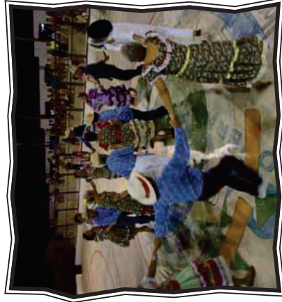
Festas Juninas – Cascavel e Fortaleza

Nos núcleos de Fortaleza, Redenção, Ocara e Cascavel, os(as) educandos(as) dançaram nas praças, animando os moradores de suas cidades, além de se deslocarem para intercambiar com outras localidades as festas juninas tradicionais do Ceará.