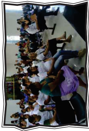
Audiência Pública – Câmara dos Vereadores – Cabo de Santo Agostinho