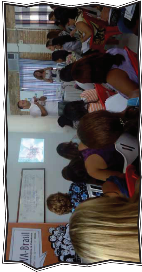
2ª Formação Geral Continuada de Monitores e Coordenadores