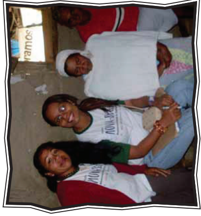
Monitora e Alfabetizandas Reserva Caramuru – Pau-Brasil

Desde 1934 os índios viviam na Reserva Caramuru, localizada no sul da Bahia, entretanto, durante certo tempo, muitos fazendeiros os expulsaram de sua localidade, obrigando-os a deixar para trás toda uma história de vida. Ao deixarem suas terras, muitos índios ficaram morando isolados, sem contato com os demais. No entanto, com o passar do tempo, estes foram se juntando e se organizando, de tal maneira que conseguiram fazer algumas manifestações para retornar e reconquistar o que era deles por direito.