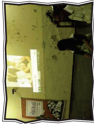
Oficina de Cinema Comentado

de cordel, onde os(as) educadores(as) elaboraram cordéis de acordo com os temas geradores. Os(as) educadores(as) aceitaram muito bem a proposta e a noite cultural foi marcada por um sarau de poesias.